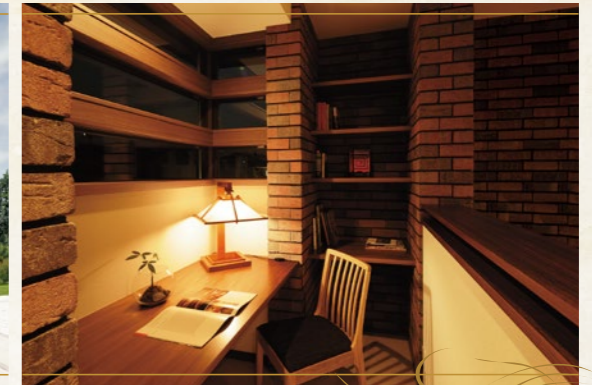
※写真は施工事例です。実際の仕様とは異なります。