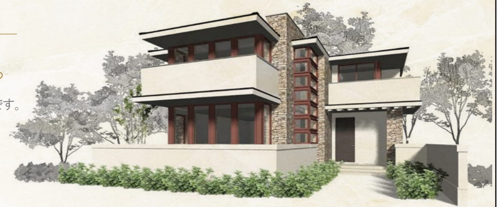
※外観パースはイメージであり、実際とは異なる場合がございます。

オーガニックハウス。は、フランク・ロイド・ライトが提唱した「有機的建築」の理念を現代の日本で最適に具現化した理想の家です。 オーガニックハウス。正規登録会員のワタナベ建設株式会社が認定住宅を提供いたします。