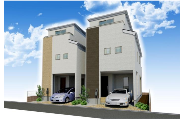
外観完成イメージパース

※掲載の完成予定CGパースは図面に基き、起こしたもので、実際とは多少異なります。