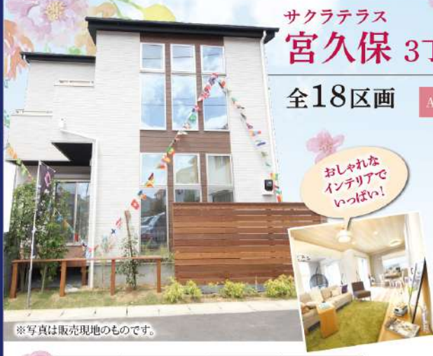
※写真は販売現地のものです。