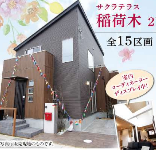
※写真は販売現地のものです。