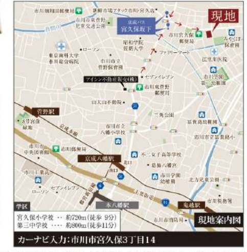
カーナビ入力:市川市宮久保3丁目14

【共通概要】所在地/市川市宮久保3丁目14 ■交通/JR総武線「本八幡」駅バス7分「宮久保坂下」徒歩6分・都営新宿線「本八幡」駅徒歩25分・京成線「京成八幡」駅徒歩22分 ■総戸数/18棟(9棟+9棟) ■土地権利/所有権 ■用途地域/第1種低層住居専用地域 ■建ぺい率/50% ■容積率/100% ■地目/宅地 ■設備/上水道・下水道・都市ガス・東京電力 【TK-7:条件付き売地概要】今回販売区画/1区画 ■土地面積/110.11㎡(33.30坪) ■現況/更地 ■接道/南側4.5m道路 【AS-1:新築分譲住宅概要】今回販売棟数/1棟 ■土地面積/108.11㎡(32.70坪) ■建物面積/106.20㎡(32.12坪) ■構造/木造2階建(在来軸組工法) ■間取/4LDK+カースペース ■完成/H30年4月 ■接道/東側6m公道・北側4.5m道路 ■売主/アイシン不動産販売株式会社(AS-1)・テイケイハウス株式会社(TK-7)千葉県知事(殿26)第38522号、国土交通大臣(第)第9068号、千葉県知事登録第1-1610-8280号、〒272-0823千葉県市川市東菅野2丁目1番1号 ■建物設計・施工会社/テイケイハウス株式会社 ■取引形態/売主(AS-1)・代理(TK-7)