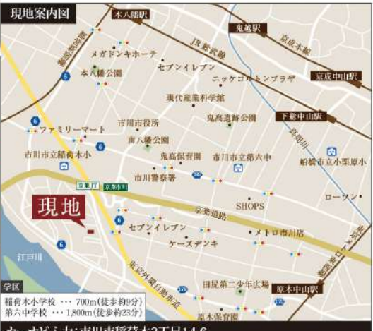
カーナビ入力:市川市稲荷木2丁目14-6